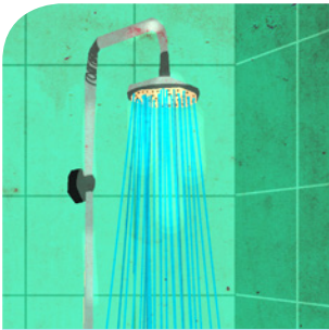
die Dusche (n)