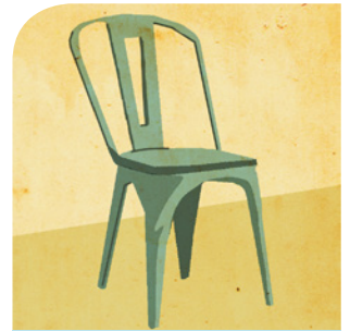
der Stuhl (-e)