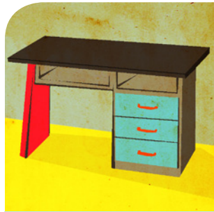
der Schreibtisch (e)