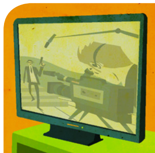
der Fernseher (-)