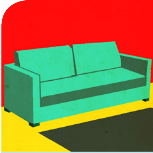
das Sofa (s)