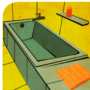
die Badewanne (n)