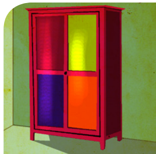
der Schrank (-e)