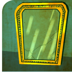
der Spiegel (-)