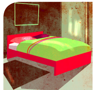
das Bett (en)