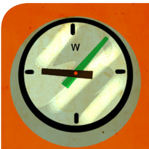
die Uhr (en)