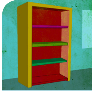
das Regal (e)