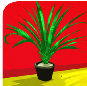
die Pflanze (n)