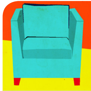
der Sessel (-)