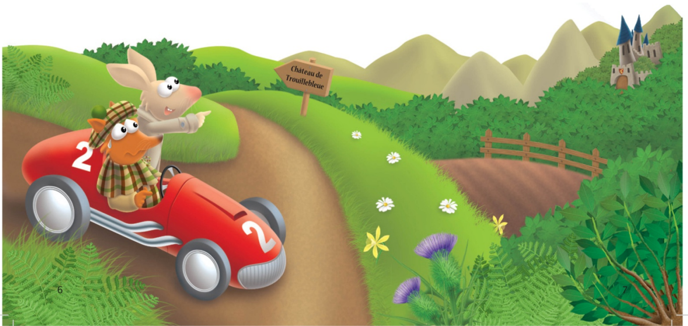
Illustration pages 6 et 7