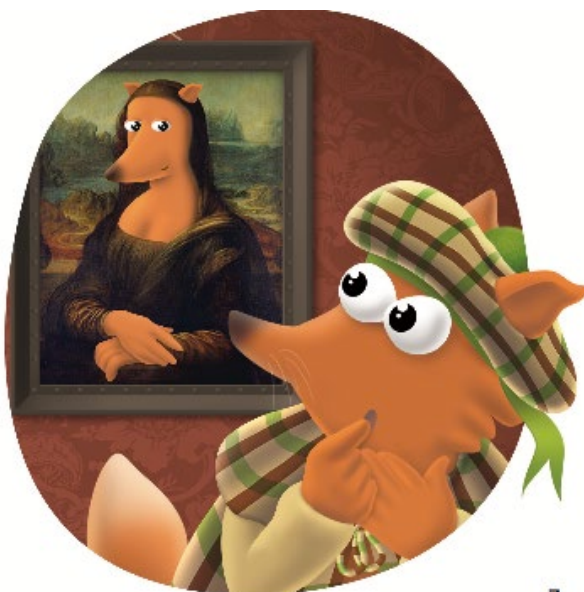
Illustration page 7