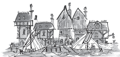
home near the river Thames