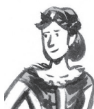
B. Lady Macbeth